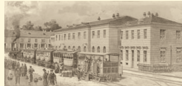
Die Architektur des Nordbahnhofes ist nur der Rahmen für das Wesentliche: die Lokomotiven, die Reisenden und das Bahnpersonal.

Der neue Nordbahnhof hatte sechs Gleise, aber keine Personenhalle. Man stieg im Freien in den und aus dem Zug. Die Züge fuhren auf einem vier Meter hohen Damm, um vor Überschwemmungen der Donau sicher zu sein. Schon bei der Rückkehr von der ersten Fahrt am 6. Jänner 1838 ereignete sich der erste Unfall. Beim Hineinfahren in den Bahnhof schätzte der