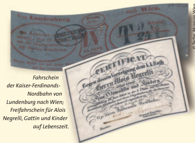
Fahrschein der Kaiser-Ferdinands-Nordbahn von Lundenburg nach Wien; Freifahrschein für Alois Negrelli, Gattin und Kinder auf Lebenszeit.

Auch in der Revolution 1848 spielte die Nordbahn eine Rolle. Die aufgebrachten Wiener hatten die hölzernen Bahnbrücken über die Donau zerstört, um den Versand von Truppen gegen die aufständischen Ungarn zu verhindern.