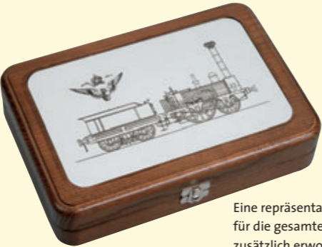
Eine repräsentative Holzkassette für die gesamte Serie kann zusätzlich erworben werden.

Die neue sechsteilige Münzenserie führt auf einen Streifzug durch die Geschichte der Eisenbahnen in Österreich. Beginnend mit der allerersten Bahnlinie, der „Kaiser-Ferdinands-Nordbahn“, wird die Serie die Eröffnung der Südbahn Wien–Triest vor 150 Jahren, die „Kaiserin-Elisabeth-Bahn“ (Westbahn) sowie die Hofzüge u. a. bis zu der Elektrifizierung der Strecken und dem modernen Bahnverkehr dokumentieren. Eine faszinierende Serie für alle Münzsammler, Eisenbahnfans und all jene, die ein Interesse an der Geschichte Mitteleuropas haben.