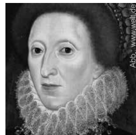
Elisabeth, die „jungfräuliche“ Königin

Und ausgerechnet dieses Verbrechen spielte der Sohn Marlowe schon drei Wochen später, am 6. Januar 1593, bei der weihnachtlichen Festaufführung am Dreikönigstag im Rahmen seines Stückes König Henry im Schloss „Hampton Court“ an der Themse nach – vor der anwesenden Königin! Es war unglaublich: Die Pembroke Players zeigten den Tod des Humphrey, Duke of Gloucester and Pembroke, auf der Bühne, und Marlowe selber sagte dazu den Text, der auf den Tod seines Vaters anspielte, weil er der Königin zeigen wollte, was für ein gemeines Spiel die Bischöfe seinerzeit, aber auch welch gemeines Spiel die Bischöfe, speziell der Erzbischof von Canterbury, bei dem Tod seines Vaters erst drei Wochen zuvor gespielt hatten.