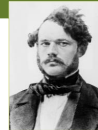
1847 Wernher von Siemens Telegraphen- Bauanstalt von Siemens & Halske