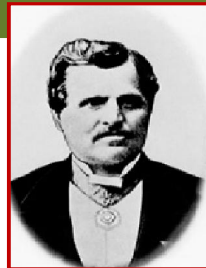
1854 J. Weitzer Waggonbau Graz