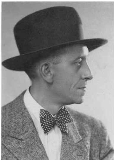
Leon Koppens: 1890–1964 (beschriftet mit Boš 25. X. 1932)

Vor mir liegt ein schmaler Band in kleinem Format mit Gedichten: Polnische Klänge , Nachdichtungen von Versen einiger Dichter des „Jungen Polen“, erschienen im Wiener Verlag Gemma 1922. 1 Der Autor ist der Altösterreicher mit Hintergrund Galizien, der polnische Diplomat, Dichter und Übersetzer, Migrant und im Exil bis zu seinem Tod im fernen Argentinien: Leon Koppens.