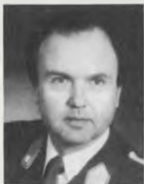
Heinz Danzmayr, Brigadier, Leiter des Institutes für Militärische Sicherheitspolitik an der Landesverteidigungsakademie; Stiftgasse 2a, 1070 Wien.

In der folgenden Darstellung soll vor allem den inhaltlichen Aspekten das Augenmerk zugewendet werden. Einige formale Abklärungen sind allerdings – insbesondere in bezug auf Entstehungsgeschichte und Stellenwert dieses Dokuments – wohl unverzichtbar.