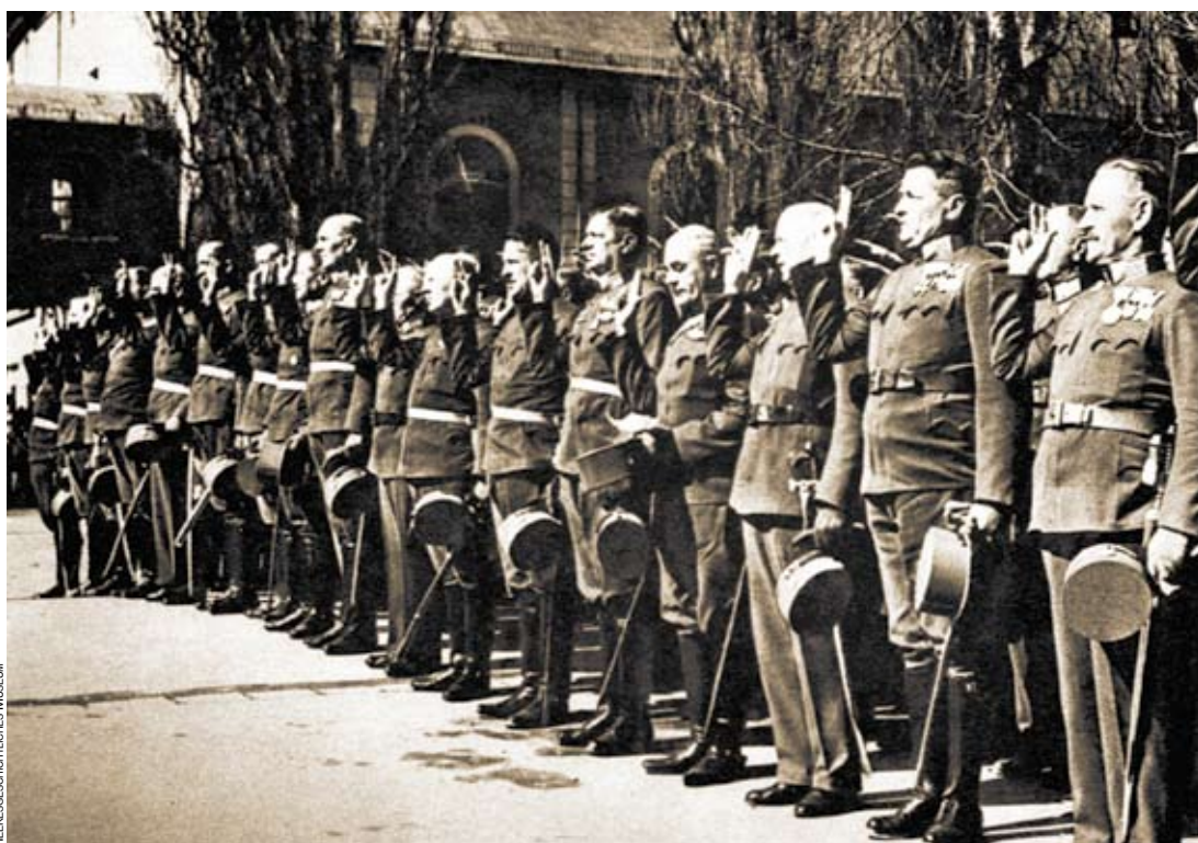
Mit dem Anschluss an das Dritte Reich war der Eid wieder gegenüber einer Person zu leisten (Bild: das Tiroler Jägerregiment wird auf Adolf Hitler vereidigt).

Im Laufe der Geschichte stellte sich - und darauf machte bereits vor einigen Jahren der ehemalige Generaltruppeninspektor des Österreichischen Bundesheeres, General Horst Pleiner, aufmerksam - immer wieder die Frage, „unter welchen Voraussetzungen eben eine Aufkündigung