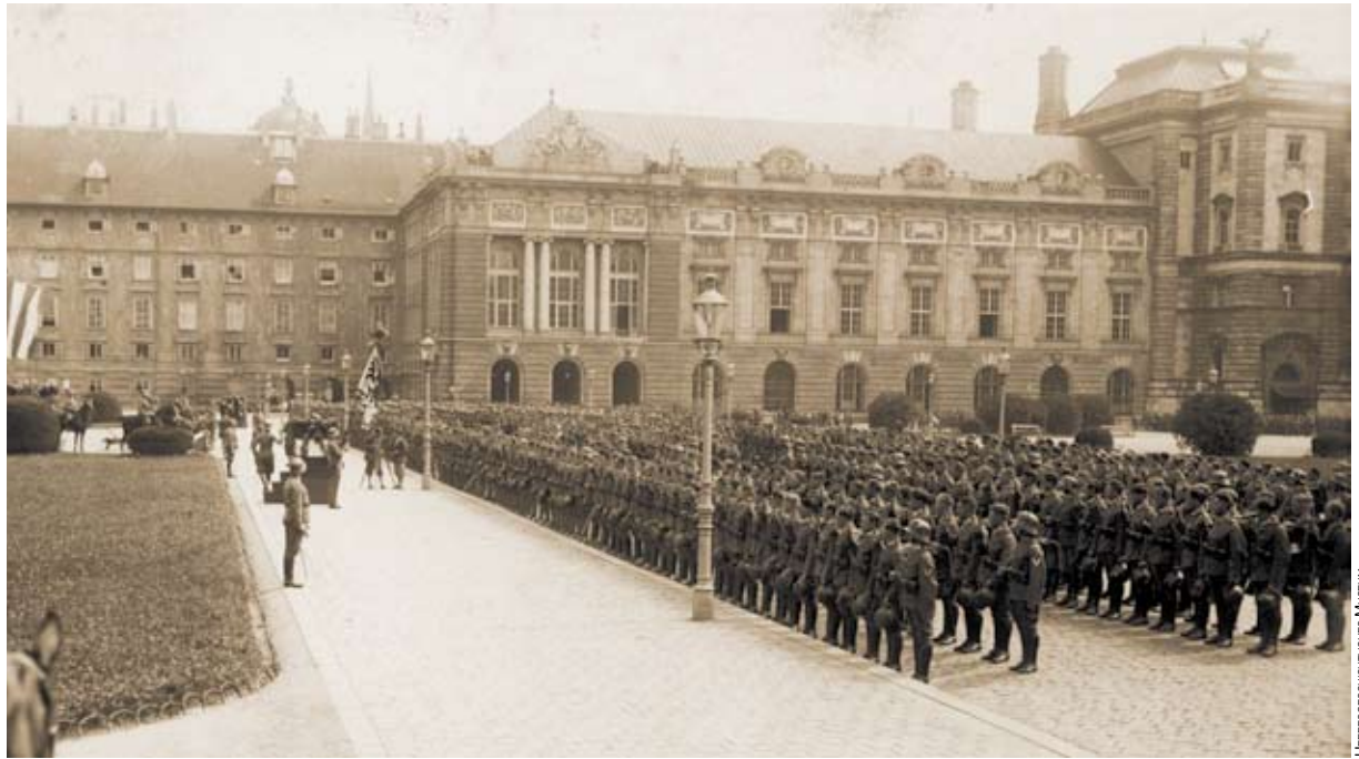
Mit der Umstellung der Staatsform auf eine Republik änderte sich auch die Eidesformel. Die Treue galt von nun an dem Staat. (Bild: Vereidigung am Heldenplatz 1929)

Übergang zur Neuzeit geriet dieses im Eid fundamentierte gesellschaftliche System ins Wanken. Im Zuge der Glaubensspaltung wurde der Staat zur Kirche, die Gläubigen wurden zu Staatsbürgern, zu gläubigen Untertanen des Staates. 15) Die Eidgenossenschaft wandelte sich zum Bürger- und Untertaneneid mit Gehorsam gegenüber dem Staat. 16)