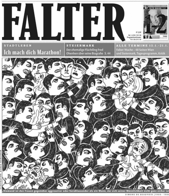
Abbildung 1: »Falter« Titelseite, 13.1.2016

Dort hält eine der sonst amorph-einheitlich gezeichneten Täterfiguren zwei Mobiltelefone in der Hand, was wohl auf die von rechtsextremen Online-Medien verbreitete Lüge anspielt, Flüchtlinge bekämen von Hilfsorganisationen teure Handys geschenkt (Siehe Detail-Darstellung in Abb. 4). Noch bedeutsamer ist aber, dass manche der Männer mit klassischen Attributen der Teufelsdarstellung gezeigt werden. Eine der Figuren hat Teufelshörner, eine andere streckt eine unnatürlich lange, spitze Zunge aus dem Mund (Abb. 5).