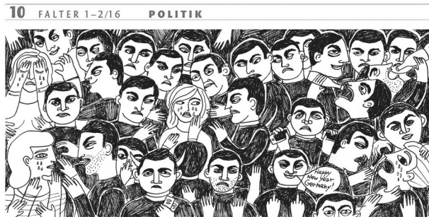
Abbildung 3: »Falter«, 13.1.2016