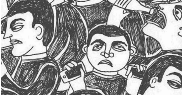
Abbildung 5: »Falter«, 13.1.2016