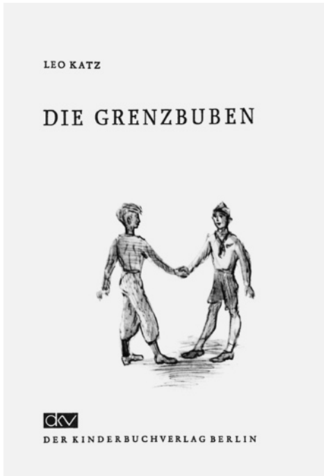
Leo Katz: Die Grenzbuben. Berlin: Kinderbuchverlag 1951, Schmutztitel.