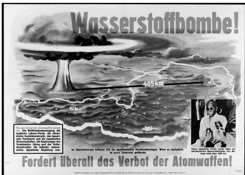
KPÖ: Wasserstoffbombe! Fordert überall das Verbot der Atomwaffen. 1954. Wienbibliothek, Plakatsammlung.

„Sie sagen ‚Gott sei Dank‘, Barbara? Ob man nicht eher dem Teufel dafür danken muß, wenn wir das Rezept gefunden haben, die H-Bombe wirklich zu starten?“ (ZGT 53) Über die „Super-Bombe“ sagt Donald seinem Abteilungsleiter Hedecronen gegenüber, sie sei „eher eine Sache des Teufels als Gottes!“ (ZGT 309) Hedecronen antwortet: