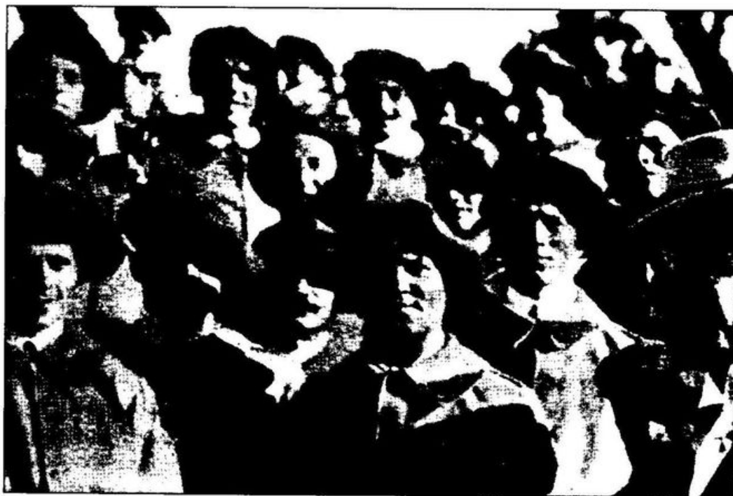
Fehlanzeige Masaryk: Der „Befreier-Präsident“ mit tschechoslowakischen Legionären in den USA 1918

In der Apperzeption der Tschechen in Wien hat sich seit dem Ende der Habsburgermonarchie ein fundamentaler Wandel vollzogen: Waren es seinerzeit die „Ziegelböhm“, die Schneider und Tischler gewesen, die massenhaft und aus rein wirtschaftlichen Gründen nach Wien gezogen waren, so kamen in der Zweiten Republik vor allem höher qualifizierte Tschechen ins Land, die kaum daran interessiert waren, als Tschechen Flagge zu zeigen oder gar Wien zu tschechisieren, wie dies in der Luegerzeit unterstellt worden war. Die Volksgruppe hatte durch einen zweimaligen Exodus gerade nationalbewusster Mitglieder ab 1918 und ab 1945 einen Aderlass erlitten, und viele Tschechen hatten sich mittlerweile, teils durch Gewöhnung, teils unter dem Germanisierungsdruck ihrer Umgebung, assimiliert.