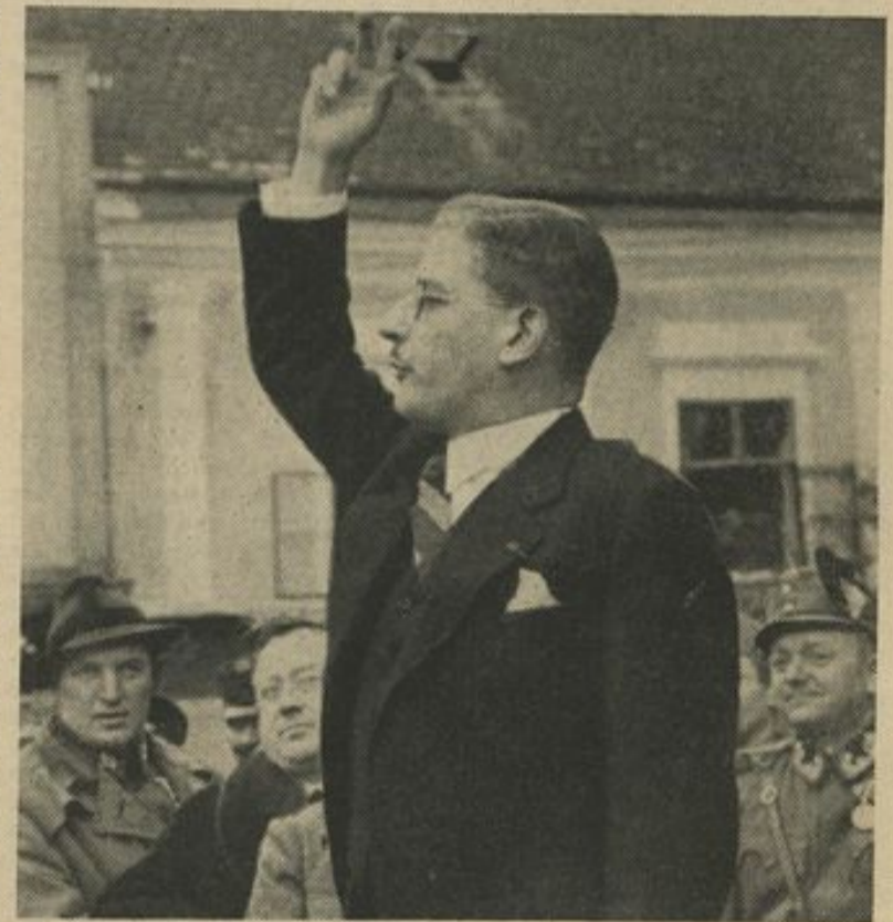
Bundeskanzler Dr. Kurt von Schuschnigg

Entscheidungskampf erst kommt, daß der „deutsche Friede“ für Hitler ein taktisches Manöver ist auf dem Weg zur unverrückbar festgehaltenen Gleichschaltung, daß der Irrationalismus der Nazis sie zu unberechenbaren Verhandlungs- und Vertragspartnern macht, daß Ekstatiker Verträge niemals halten, daß wir daher auf der