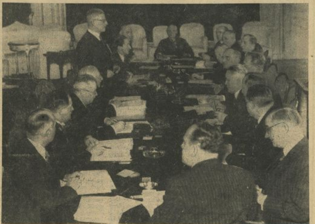
Der letzte Ministerrat

(Die Veröffentlichung wird im nächsten Blatt abgeschlossen.)