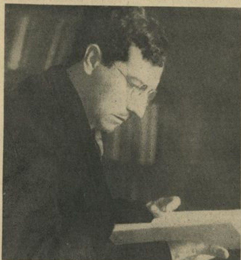
Dr. Ernst Karl Winter

diese Auffassung, da sie jede Garantie der Unabhängigkeit Österreichs vermied. In Österreich hingegen hatte die Regierung eine Reihe einschneidender Wünsche Deutschlands im Vorhinein erfüllt und den Nazis drei Tage lang „Straße frei“ gewährt, ihren Sieg zu feiern. Völlig überraschend kam daher für die ganze Welt und für ganz Österreich, für Freund und Feind, die Erklärung vom 24. Februar, die bei allem