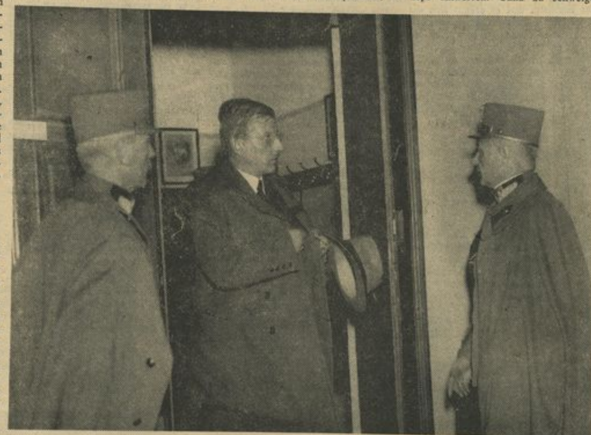
WIRD WIDERSTAND GELEISTET! Bundeskanzler Schuschnigg nach der Rückkehr aus Berchtesgaden zwischen Feldmarschalleutnant Jansa (links) — die Seele des Widerstandes im Bundesheer — und Bundesminister für Landesverteidigung General Zehner (rechts). Mit Jansas Verabschiedung war alles entschieden...

Ein totaler Angriff Deutschlands auf Österreich, der überraschend erfolgt und im Zuge einer deutsch-italienischen Gesamtaktion gegen mehrere