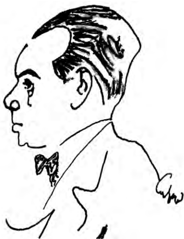
Abb. 4: Regisseur des Bruderzwists 1932 ( Das Kleine Blatt , 23. 10. 1932, S. 18).