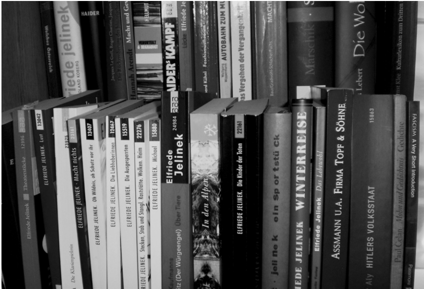
Abb. 3: BücherBücher