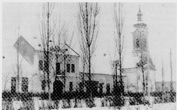
Hotelgaststätte „Stock“, Kleiderfabrik Schwendner und reformierte Kirche.