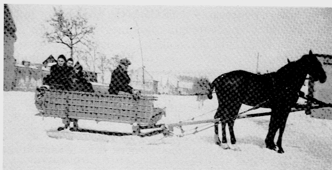
Schlittenfahrt im Winter — für Menschen und Pferde ein Vergnügen.