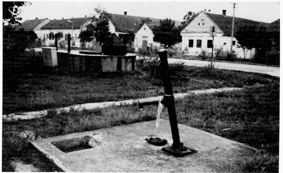
Artesienbrunnen vor der ehemaligen Schlosserei Haip

Für den weiteren Lebensweg wünschen wir der Jubilarin alles Gute, vor allem aber weiterhin beste Gesundheit.