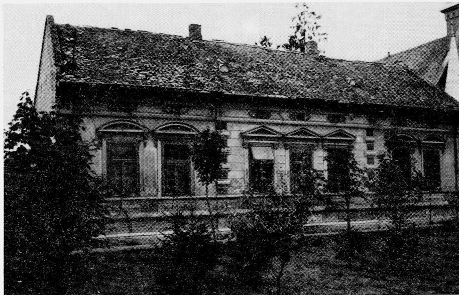
Bauernhaus Konrad Vetter, untere Hauptgasse, 1988