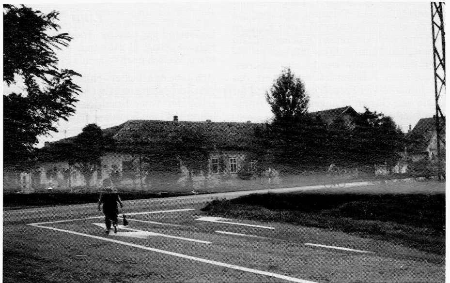
Verlassene Dorfstraße mit Eckhaus, 1988

Die Heimleit han sich ewe an die Heimordnung ghal, die g'laut hat: daß s Heim nore for geistich-kulturelle Zwecke, for die Volksbildung do is un net for Parteipolitik mißbraucht werre derf. Deswe hats domols a kee Neid un kee Streit unr d' Heimleit net geb. D' Tonivetr, e stets nichtrnr un weit-