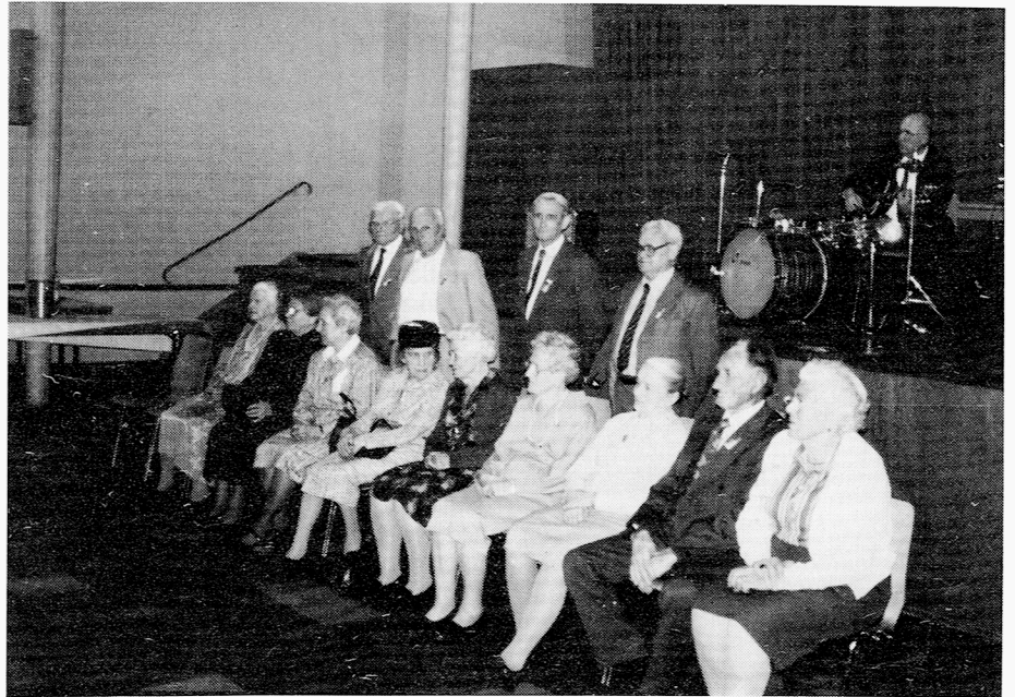
Seniorenehrung beim Treffen in Pforzheim, 1988

An eem scheene, heiße Spotjohrstag im Jahr 1914, um dreivertl ee Uhr mittags, hat zufällig d' Gmeehauschreiw'r Kármán Géza Telefondienschts ghat. No eem uffg'regte Telefong'spräch werft d' Tinteleckr d' Telefonherer hi. In dem Aueblick springtr a schon tapp'r uff, wie wannr sich uff ee heiße Sparherdplatt gsetzt ghat hätt. Er rudrt mit d' Ärm dorch die Luft zum Natari