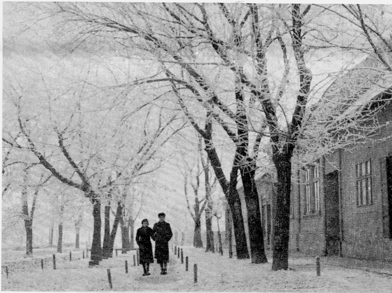
Ein Wintertag im früheren Tschernwenger

„Alli Eehr gheert Gott im Himml! Sei Friede gilt alle Mensche uff d' Erd, die sich vun ihm liewe losse!“