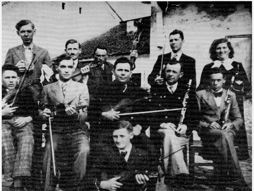
Das Bild zeigt von links stehend:

Gründung reformierter Gemeinden in Kroatien im 19. Jahrhundert (XIII), Kirche und Schulen in Kroatien (XIV), Entwicklungen und Ereignisse im neuen Staat