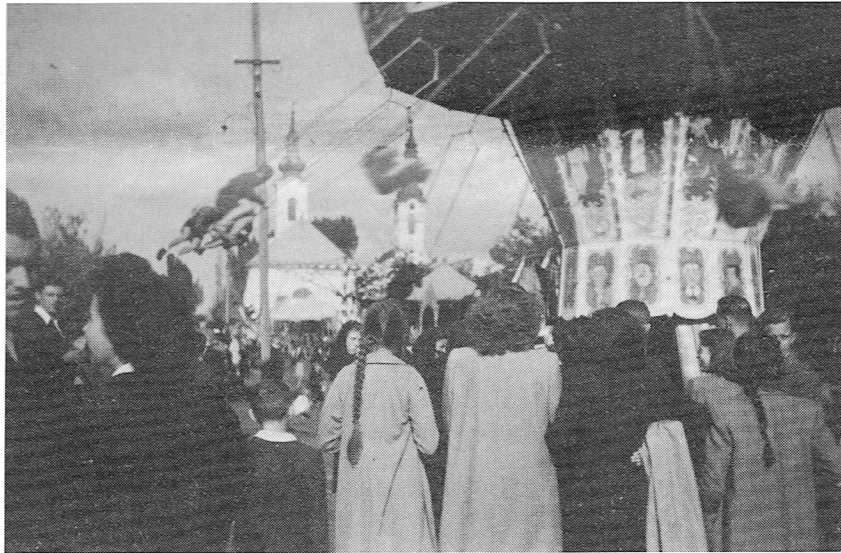
Tschervenkaer Kirchweih: Kettenkarussell, im Hintergrund die beiden protestantischen Kirchen als „Jubilare“.