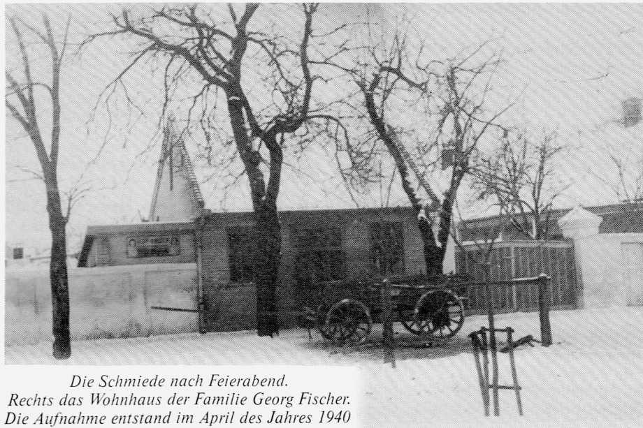
Die Schmiede nach Feierabend.

hende Hufeisen zur Anpassung auflegt, hört man ein lautes Zischen; brenzlicher Rauch steigt auf und es riecht ringsum nach verbranntem Horn. Das junge Pferd legt ängstlich die Ohren an und beginnt zu wiehern. Nachdem das Hufeisen zischend im Wassereimer abgekühlt ist, legt es der Meister wieder auf und treibt geschickt die Hufnägel mit dem Beschlaghammer durch Eisen und Huf. Das unruhige Tier schlägt mit dem Schweif um sich, aber kräftig zupackende Männerhände beruhigen es bald, bis es, neubeschlagen, wieder vor den Wagen gespannt wird und sichtlich erleichtert davongaloppiert.