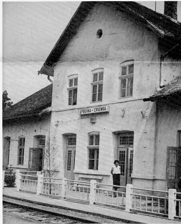
Bahnhof Tscherwenka nach 1945