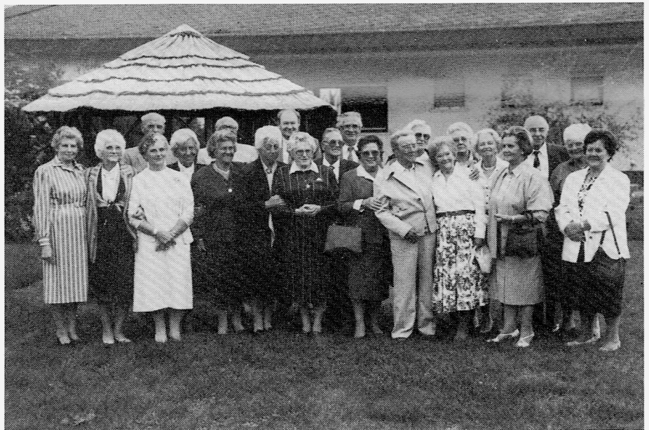
Im Landgasthof Ziegle in Hütschenhausen.

Im Jahr 1934 erging an Schulklassen in den Orten Langwieden, Martinshöhe, Bruchmühlbach, Hütschenhausen und Katzenbach ein Aufruf, in 2 Jahren einen Besuch bei den Auslandsdeutschen in der Batschka zu machen. Interessierte konnten sich melden und sparen. In diesen Vorbereitungsjahren lernten wir Volkslieder und Volkstänze, die wir in den „Gesellschaftsabenden“, gemischt mit dem Programm der jeweiligen Gastgebergemeinde, aufführten. Zwei Jahre, die schnell vergingen und endlich am 6. 4. 1936 abends standen wir am Bahnhof Landstuhl und fuhren mit dem D-Zug ab. München war unsere erste Zwischenstation. Hier besichtigten wir die Stadt, nächtigten in der Jugendherberge und fuhren weiter nach Wien. Stadtbesichtigung mit Mitglieder der deutschen