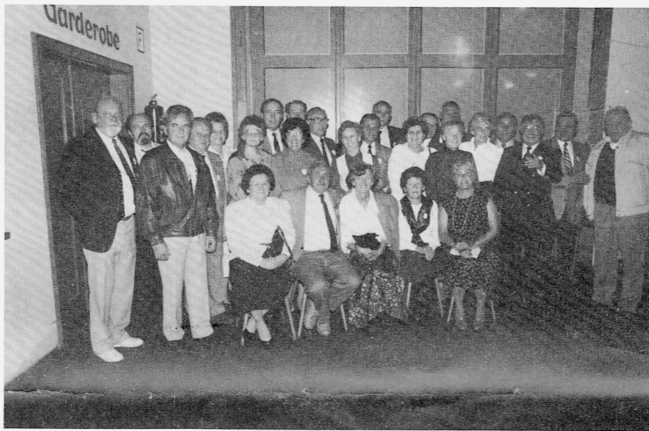
Jahrgang 1929, die 60er Gruppe