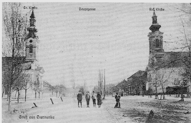
Die beiden protestantischen Kirchen vor dem 1. Weltkrieg. Die Ansichtskarte wurde am 19. März 1907 in Cserevka abgeschickt und gestempelt, am 20. bereits in Budapest angekommen. Empfänger: Schneider Jakob Kleesz. Außerdem enthält die Rückseite der Karte (Levelező-Lap) die Angabe: Verlag Julius Fuchs, Cserevka. – Liebe Landsleute, wer noch ähnlich interessante Ansichtskarten von zu Hause besitzt, kann sie für die Heimatzeitung kurzfristig zur Verfügung stellen.