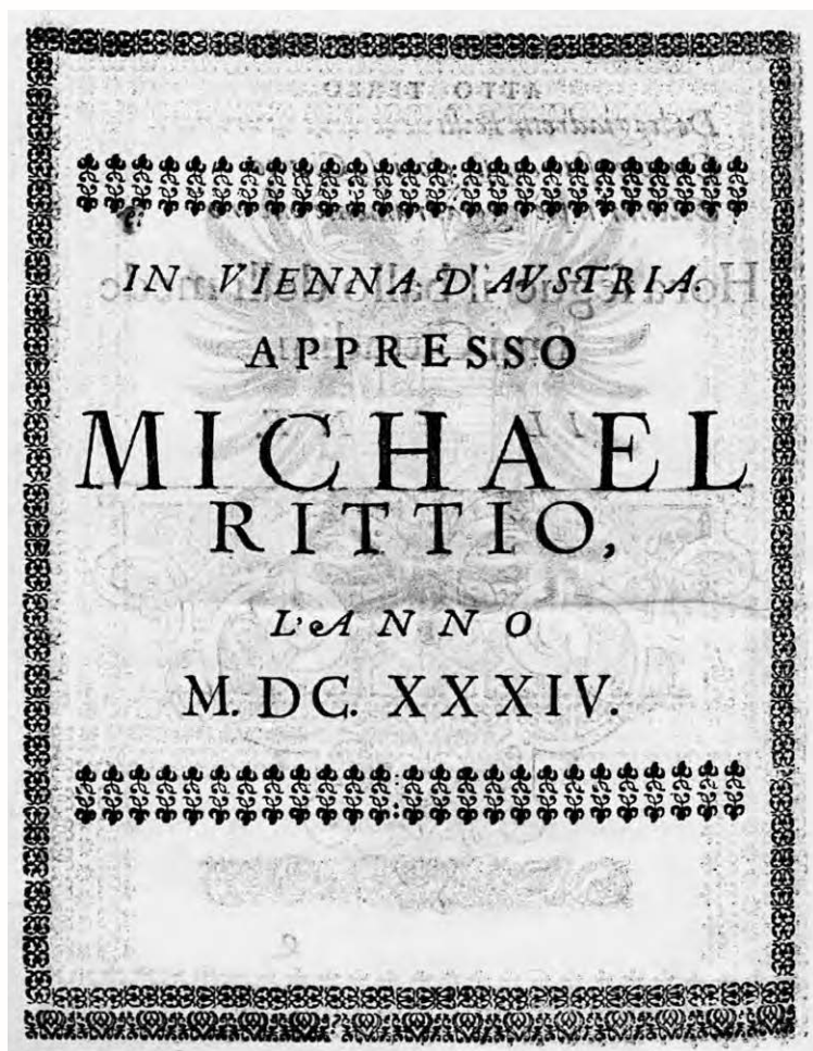
Druckernachweis aus Urbano Giorgi: La gara musicale . Öst. Staatsarchiv Wien.