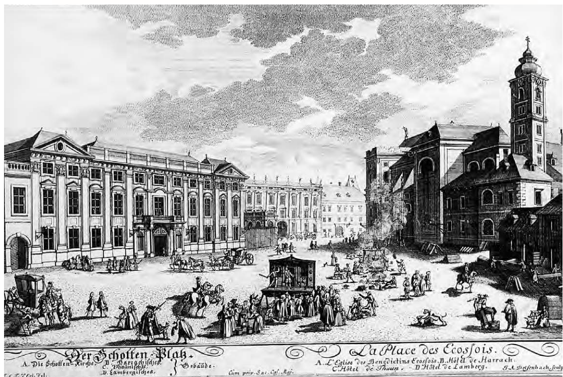
Schottenplatz mit Theaterbude. Stich von Johann Adam Delsenbach (um 1720). ÖNB Wien.