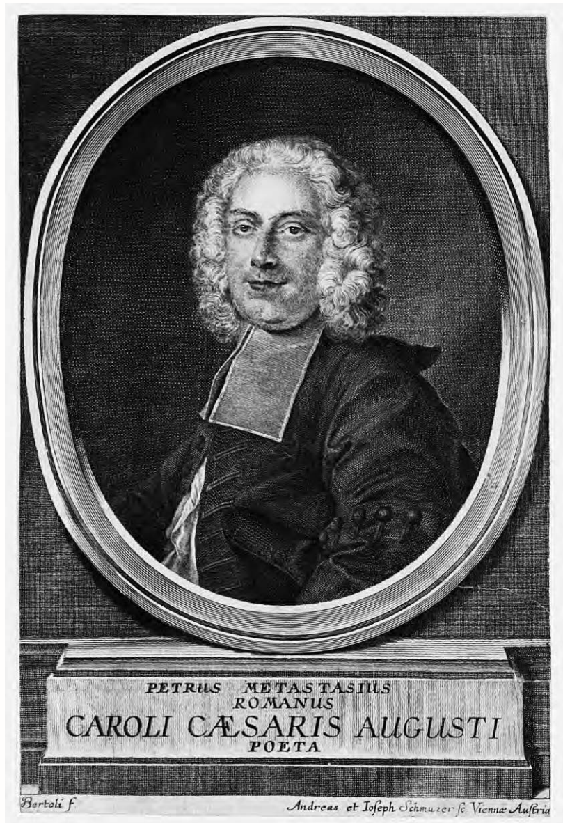
Porträtstich Pietro Metastasio.