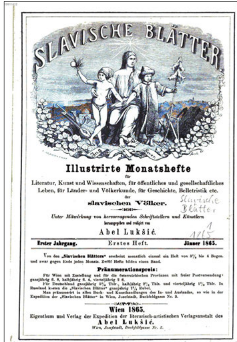
ABBILDUNG 1: TITELSEITE, Jg. 1

geistige Thätigkeit im ganzen Südslaventhume«. 16 Dementsprechend ist auf der Titelseite der Zeitschrift die allegorische »Mutter Slavia« bei Morgenröte abgebildet, zwei Söhne umarmend, welche Symbole des Südens und Nordens in ihren Händen tragen. Am unteren Rand steht in kroatischer Sprache »Süden« (Jug) und »Norden« (Sever) geschrieben (s. Abbildung).