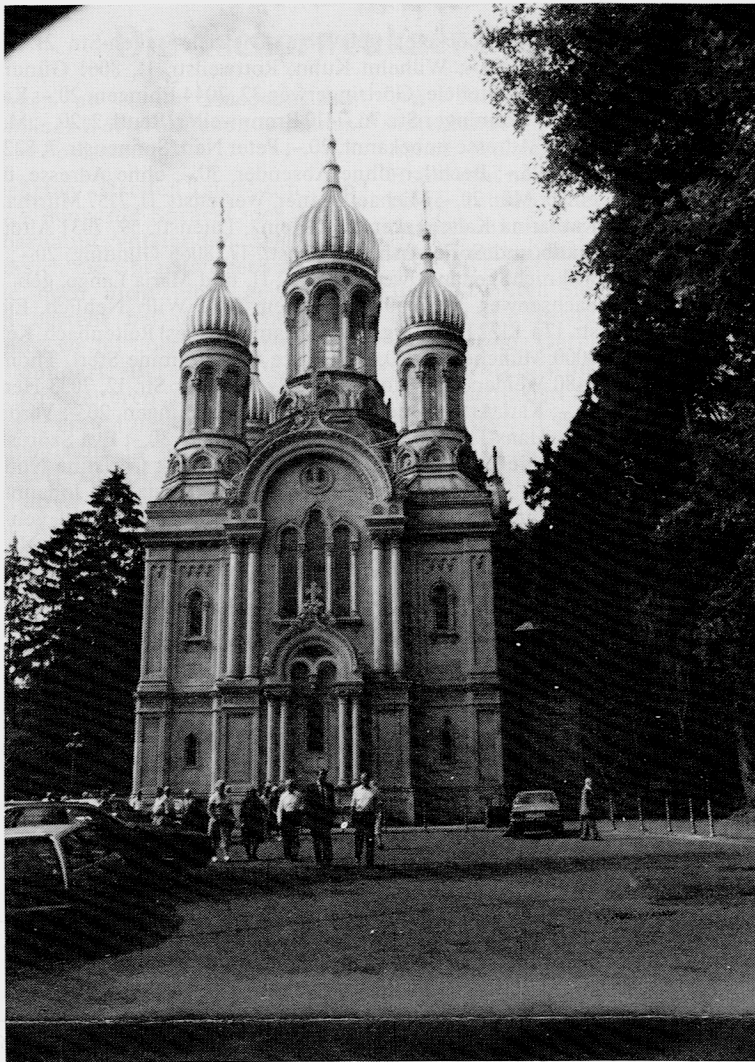
Donauschwaben, darunter viele Tschervenkaer, aus Herrenberg besuchten mit einem Reisebus die beiden Landeshauptstädte Mainz und Wiesbaden, wo vor der Russischen Kapelle obige Gruppenaufnahme entstand.