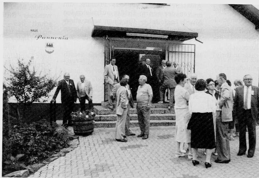
Tscherwenkaer Treffen im Haus Pannonia, Speyer 1988