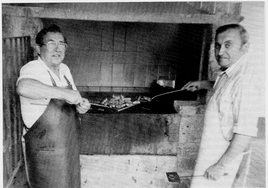
Roschtennes beim Speyerer Treffen