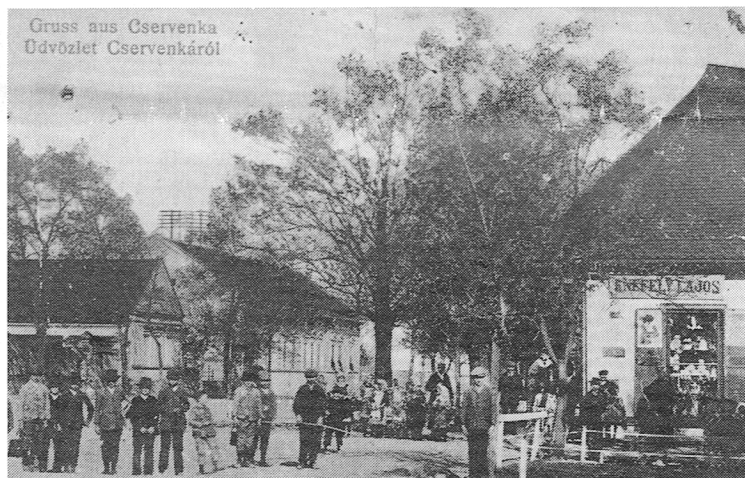
Postkarte vom Beginn des Jahrhunderts mit Schulkindern vor dem Geschäft Ludwig Knefely