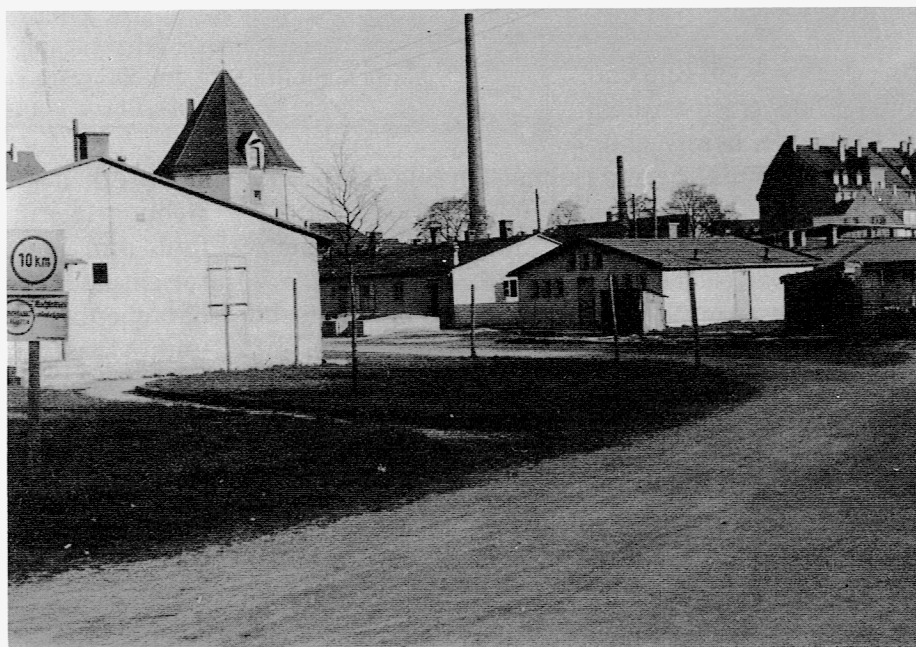
Das Impler-Lager in München anfangs der 50er Jahre von der nördlichen Wackersberger Straße aus gesehen, links die Gemeinschaftsbaracke mit der Lagerverwaltung, in der Mitte die Baracke mit den Werkstätten der Handwerker und rechts die Sanitärbaracke mit Einzeltoiletten.

Aus jetziger Sicht dürfen wir dem lieben Gott danken, weil er uns nach so viel Leid und Not eine neue Heimat gegeben hat, in der wir mit unseren Kindern und Enkelkindern ein Leben ohne Angst auf eine neuerliche Vertreibung führen dürfen. Dabei denke ich auch an die Landsleute da unten, die wieder in Gefahr an Leib und Leben sind. Unsere Heimat aber ist dort für immer, wo uns Gott die Stätte bereitet hat, wo es keine Träume und kein Leid mehr gibt, wie eine Tafel über dem Eingang unseres Heimatfriedhofes bekundet. Ich wünsche Euch, liebes HA-Team und allen