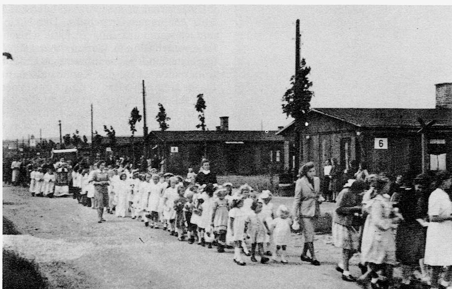
Lager mit Schulkindern und Prozession in der Nachkriegszeit.