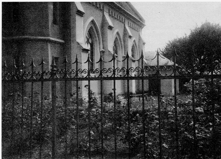
Um die katholische Kirche in Tscherwenka herum blüht es wieder.