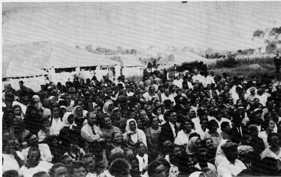
Besucherschar während der 150-Jahr-Feier 1935.

Czerwenka, ehemals berühmt durch seinen Gewerbefleiß und sein Handwerk (noch heute stehen Tischler- und Schreinerhandwerk, wie ich selbst verschiedentlich sah, in hoher Blüte) erlitt den ersten Stoß durch den Bau der Hauptbahn an der Linie Subotica – Novi Vrbas – Neusatz, durch den Werbaß zum wichtigsten Bahnknotenpunkt und kulturel-