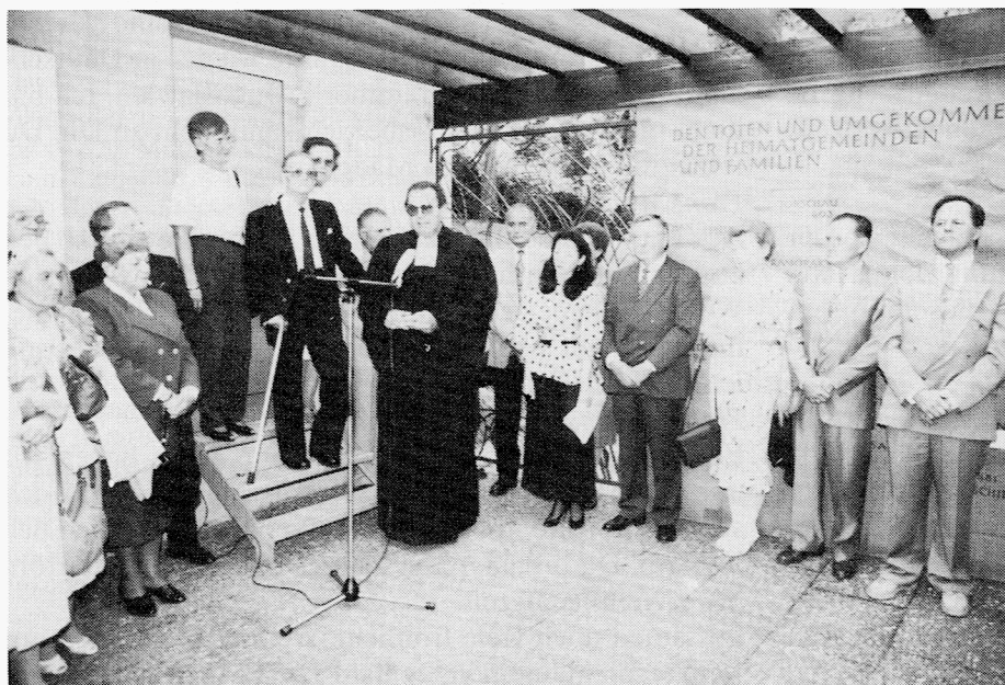
Im Lichthof des Hauses der Donauschwaben bei der Enthüllung des Ortsnamens auf der Gedenkwanne.

Nun sollten wir unsere Opfer ehren, ihnen das Mal weihen, wie wir zur 200-Jahr-Feier auf dem Münchner Waldfriedhof einen Gedenkstein gesetzt haben, und an dieser und manch anderer Stelle fürderhin rasten, Gedenkminuten einlegen, der Entschlafenen gedenken und unser Leben darauf einstellen, daß wir dem eigenen Ende näher gerückt sind, bis dahin aber weiterhin unseren Mann bzw. unsere Frau stehen, weil wir uns von Gott gehalten und gesegnet wissen, jetzt und immerdar.“