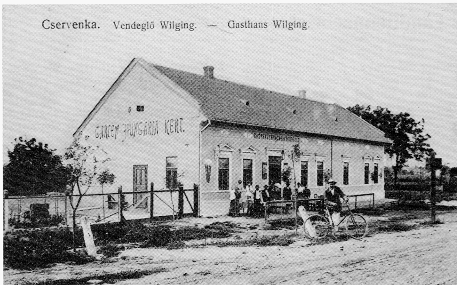
Die Ansichtskarte „Gasthaus Wilging“ wurde 1907 gedruckt und von einem Ortsbürger am 11. August 1911 an einen Tschervenkaer Schneidermeister nach Pest verschickt. Auch ein Stück Alt-Tschervenka. (Einsenderin: Henny Welker)

jahre des Patenkindes bis zur Konfirmation erhöhte. Mit der „Abbitte“ und der daran anschließenden Konfirmation hörte das „Godehole“ (Geschenkeholen) auf. Aber bei der Hochzeit wurde in mehreren Fällen der Pate „Beistand“ (Trauzeuge) und ließ sich nicht „lumpen“. Unter Umständen hatte ein Patenjunge mehr Vertrauen zu seinem „Phatt“ als zum eigenen Vater. Paten und Patinnen waren geachtete und respektierte Personen.