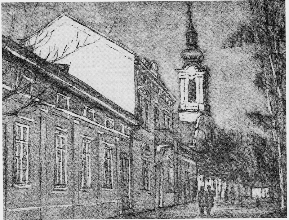
Radierung mit Reformierter Kirche und „Stock“ von Magdalene Kopp-Krumes.