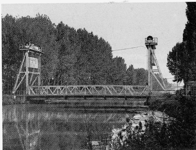
Heutiger Zustand der oberen kleinen Brücke.

Die vom Kanalbau verursachte Zerschneidung Tschervenkas in zwei Teile ergab die Notwendigkeit des Brückenbaus. Die drei Brücken im Ortsbereich – von den beiden Fußübergängen am Hotter einmal ganz abgesehen – verliehen dem Dorf nahezu etwas Kleinstädtisches. Dienten sie nicht nur neben dem Personenverkehr den landwirtschaftlichen Fahrzeugen sondern auch den industriellen Bedürfnissen als Beförderungsmöglichkeit, z. B. von der Zucker- und Spiritusfabrik oder den ebenfalls westlich vom Kanal gelegenen Mühlen.