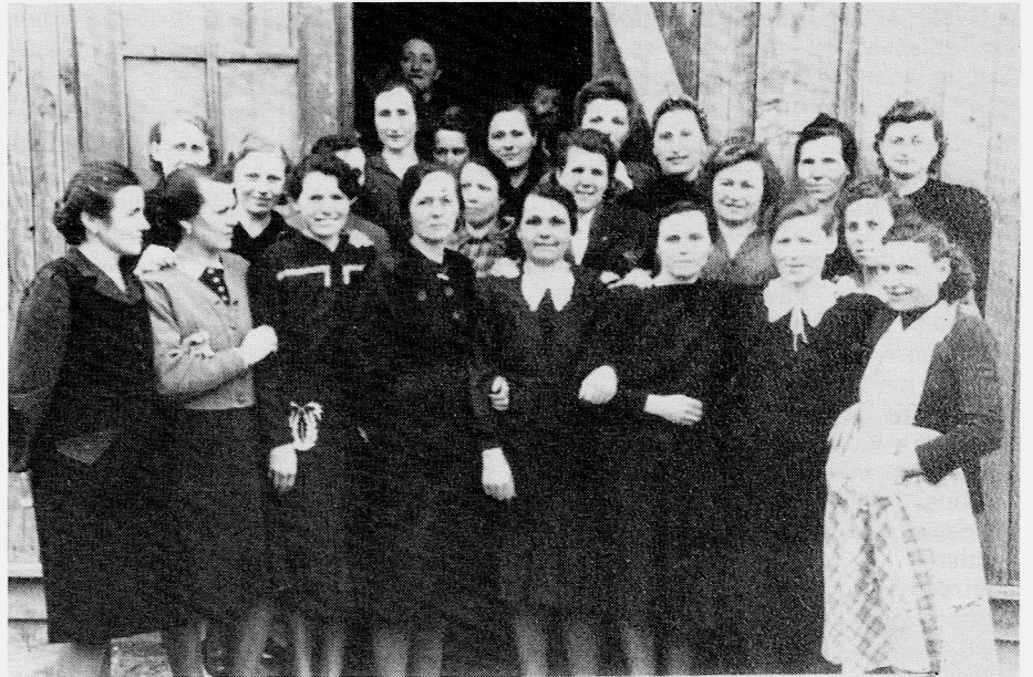
In der Nachkriegszeit befanden sich viele Tschervenkaer im Lager Schloß Kobenzel/Wien (1944-46).

Kranastl w = (alte Frau, verächtlich) Kränk w = (Fluch) Kranzl s = Brautjungfer Krapaz m (serb.) = Dieb Kräpplche s = Kräpfchen Krappr w = Krapfen krapsche = (rasch zugreifen) Kräsch m = Schrei Krauthäpfr m = Krautkopf Krawat m = Kroat Krawattl s = Krawatte, Hals, Selbstbinder krawle = krabbeln, klettern, kriechen Kräks w = (kränkerliche, zimperliche Frau) kräkse = jammern, stöhnen Kraxn w = Rückentragekorb krecht = bekäme kreislich = abscheulich Kreiz s = Garbentriste, Kreuz, Wirbelsäule kreize = (Garben über Kreuz legen) Kreizgäß w = Quergasse Kreizgäßler m = (Bewohner der Quergasse) Kren m = Meerrettich krepeere = krepieren kreppe = stecken, sich ärgern Kres m = Kreis Kresjacht w = Kreisjagd Kretteche s = Krötchen Krewet s (serb. krevet) = Bett (Marsch ins Krewet!) Kriech m = Krieg krieche = Krieg führen Kriklmäische s = Grille, Heimchen Krimliche s = Krümchen, Stückchen krimle = krümeln kringlrum = ringsum Kripp w = Krippe Krischan m = Kristian Krischr m = Schreier Krischtin, Tini, Tinka w = Kristina Kritsch w = Hamster, (dickes Kind) kriwle = kribbeln Kriwlnuß w = Steinnuß, Nörgler, Krakeeler Krohne m = Faßhahn, Zapfröhre Kropp m (Mehrz. Krepp) = Kropf Krone w = Gräte Krott w = Kröte, Frosch Krottehut m = Pilz Krottegieksr m = (stumpfes Messer) Krotteloch s = Weiher, (Flurname)