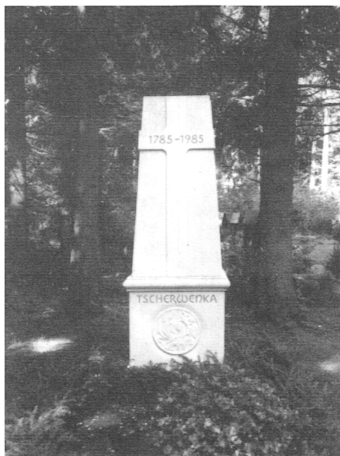
Tscherwenkaer Gedenkstein am Waldfriedhof in München, 1985 aufgestellt und eingeweiht, gewidmet den Toten in der alten und neuen Heimat.