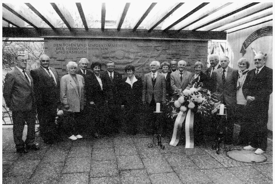
Kranzniederlegung an der Totengedenkwand.