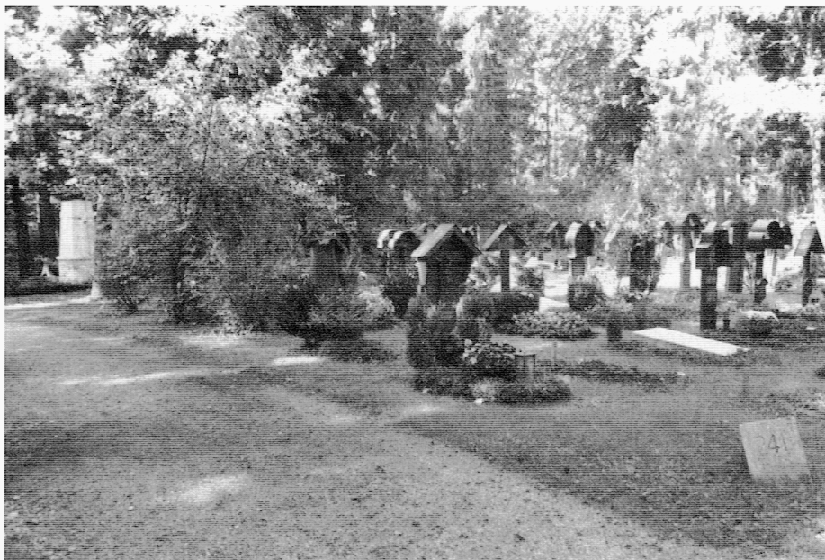
Gräberfeld im Alten Teil vom Waldfriedhof in München, wo viele Tscherwenkaer Landsleute ihre letzte Ruhestätte gefunden haben. Links im Hintergrund der Tscherwenkaer Gedenkstein.