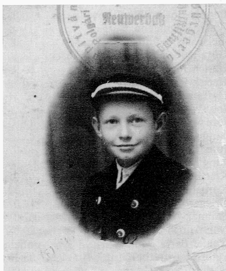
Ein sog. „Fahrender Schüler“ von Tscherwenka im Jahre 1941 mit damals modischer Kletterweste (= zweireihige, schwarze Cord-samtjacke mit Hirschhornknöpfen) und Schülermütze der Werbasser Bürgerschule.

Um Vormerkung dieser Termine und um einen möglichst zahlreichen Besuch der Veranstaltung bittet Euer Heimatausschuß Tscherwenka in München.