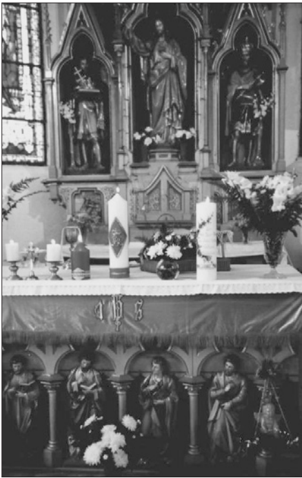
Altar der katholischen Kirche in Tschervenka bei der Messe