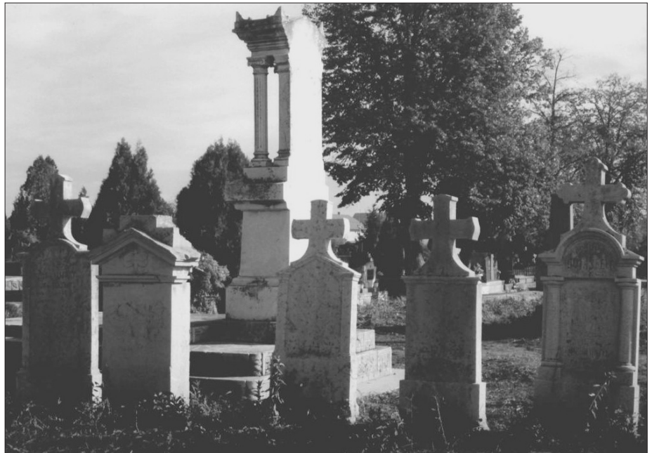
Die ältesten Gräber des „Deutschen Friedhofes“

Im Kulturhaus erwartete man uns bereits wieder mit Süßem aus der Keksfabrik sowie Orangensaft, Cola, Schnaps und Likör. Die Vorführung eines alten Schwarzweiß-Filmes zeigte