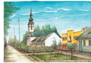
Best.Nr.: 07 Evang. Kirche, Schulen, Volksh. und Pannonia