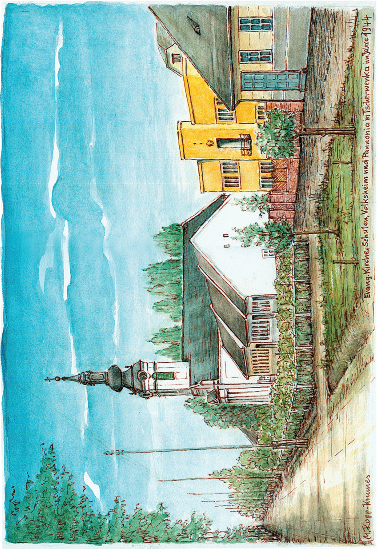
Evangelische Kirche, Schule, Volksheim und Pannonia