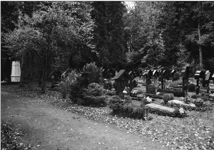
Der Tschervenkaer Teil vom Waldfriedhof mit dem Gedenkstein im Hintergrund