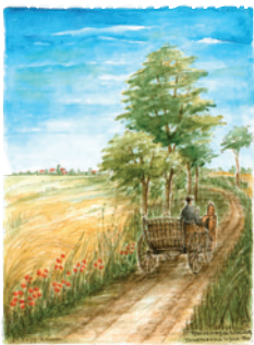
Best.Nr.: 01 Pferdewagen heimwärts