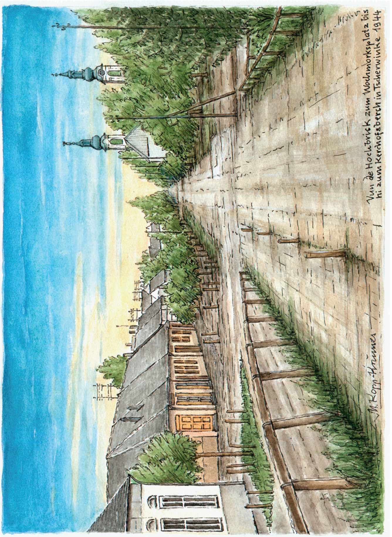
Vun de Hoch Brick zum Wochmorksplatz bis hi zum Kerchofsberch