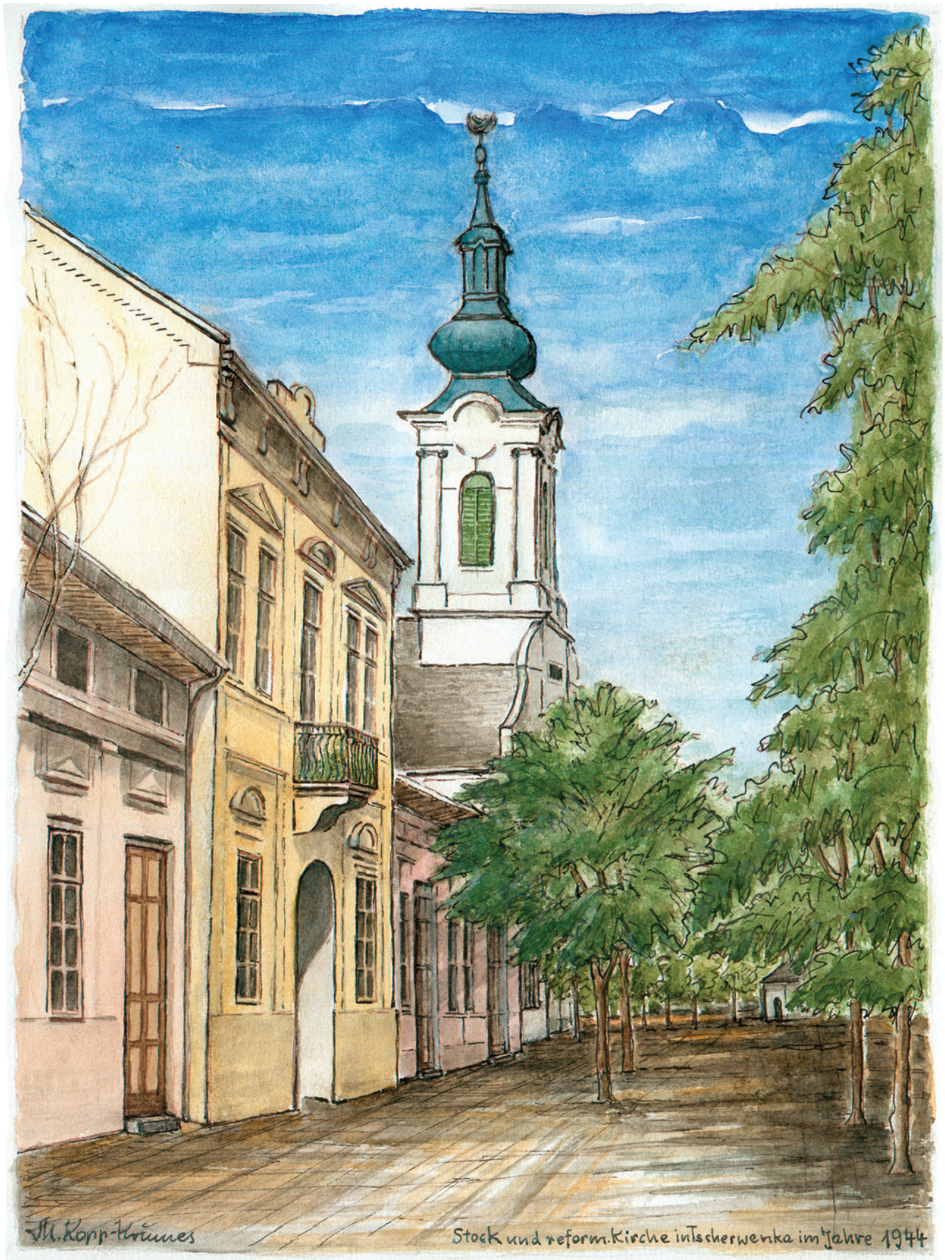
Stock und reformierte Kirche