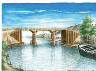
Best.Nr.: 06 Hohe Brücke