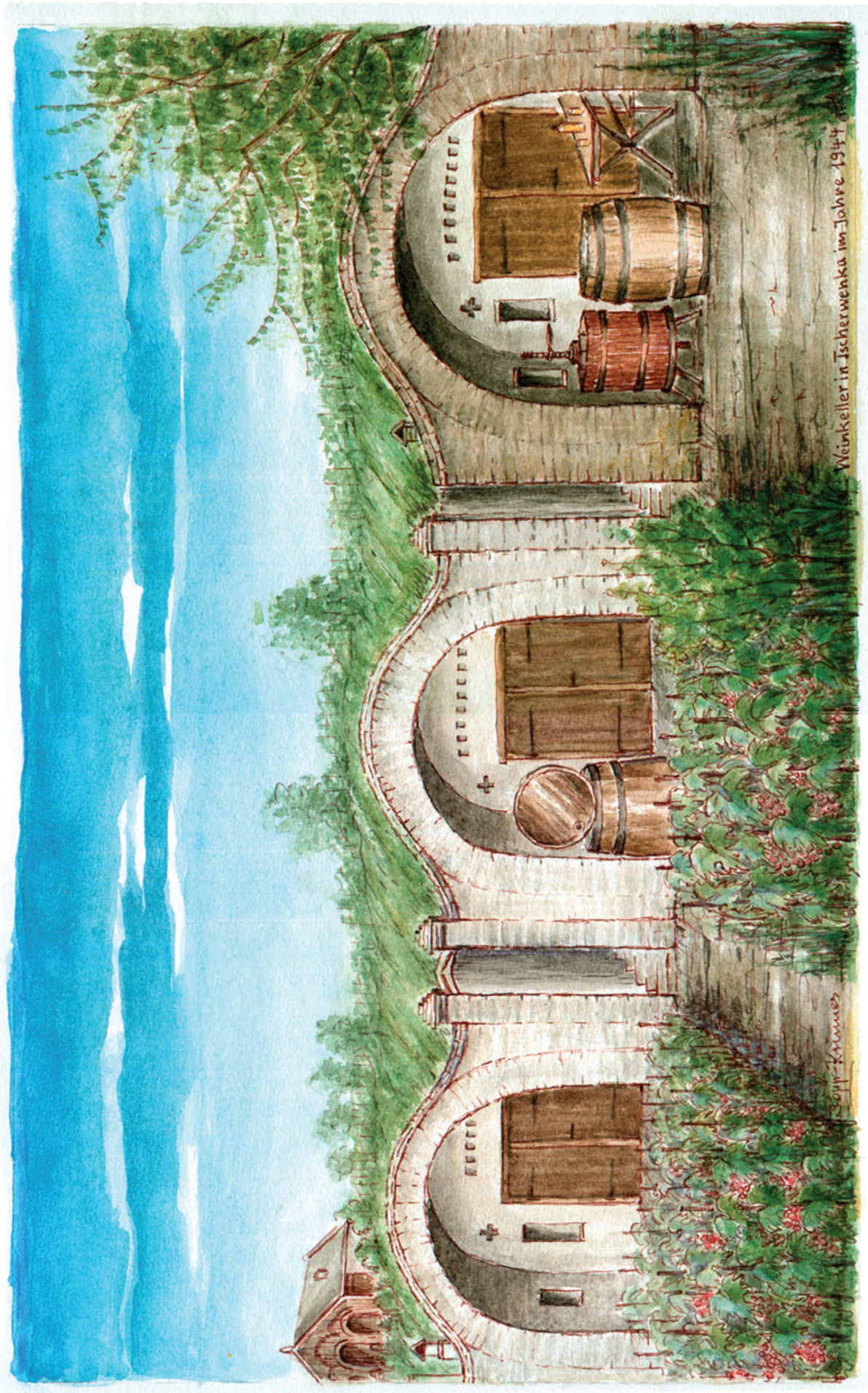
Weinkeller in Ischerwenka im Jahre 1944