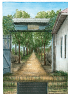
Best.Nr.: 05 Friedhofseingang