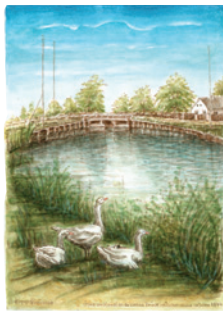
Best.Nr.: 04 Gäns am Kanal