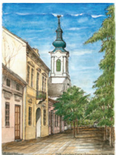
Best.Nr.: 02 Stock und reform. Kirche