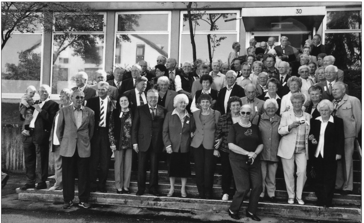
Das traditionelle Gruppenbild beim Hauseingang

Dies entspricht nicht den Vorstellungen des Heimatausschusses. Wir waren nur an einer Sanierung der heutigen Ruine des Mausoleums interessiert, um den endgültigen Verfall zu unterbinden!