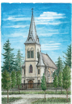
Best.Nr.: 03 Röm.-kath. Kirche