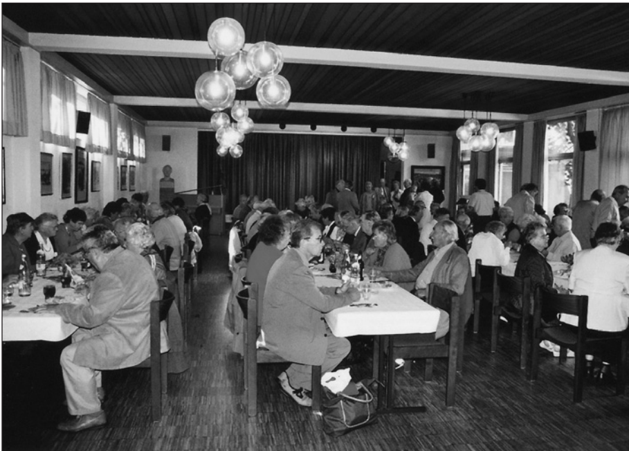
Blick in den gut besetzten Festsaal