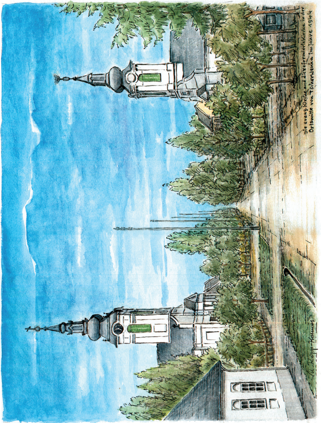
Die evangelische und die reformierte Kirche in der Ortschaft von Tschervenka