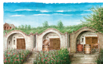
Best.Nr.: 09 Weinkeller