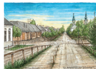
Best.Nr.: 10 Vun de Hoch Brick zum Kerchofsberch

Jedes hier gezeigte Bild wird einzeln von Hand auf 300 g Spezialpapier als Tusche-/Aquarell-Original angefertigt. Bestellungen zum Preis von je Euro 110,- plus Versandkosten. Bitte Bestell.Nr. und Bildtitel angeben. Der Versand erfolgt in einer Versandrolle (Durchmesser 12 cm). Die Bilder können problemlos in einen 40 x 50 cm großen Fertigerahmen eingefügt werden.