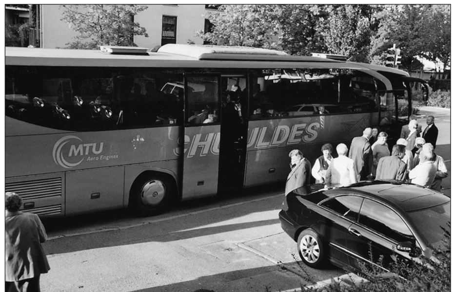
Ankunft vom Münchner Bus

Da auch bei unserem diesjährigen Heimattreffen viele unserer Landsleute aus gesundheitlichen Gründen nicht unter uns sein konnten, werden die