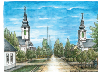
Best.Nr.: 08 Evang. und reform. Kirche